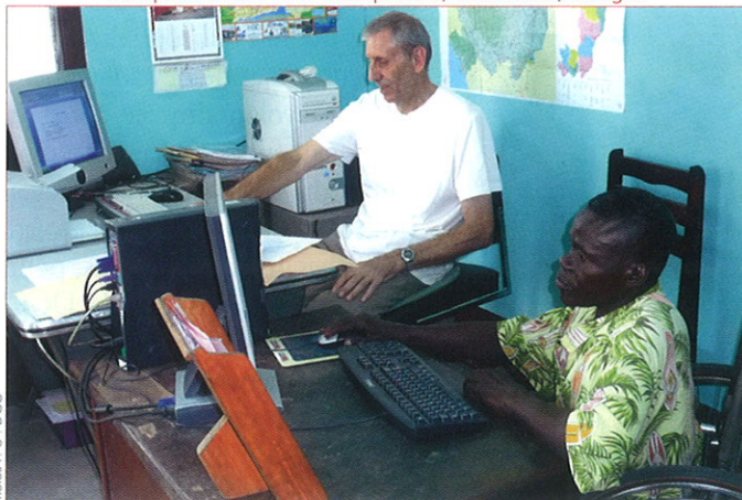
Coopérant DCC à l'École spéciale, Brazzaville, Congo.