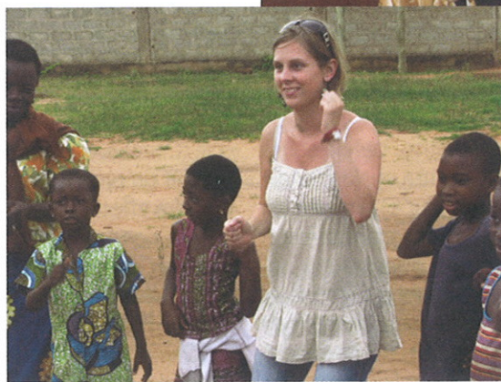
Chaque été, des étudiants de l'Isfec Emmanuel-Mounier partent avec l'association ABC Partage faire « L'école des vacances » au Togo.